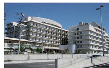
府中病院 (徒歩約31分 約2500m)