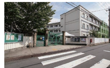
伯太小学校 (徒歩約9分 約700m)