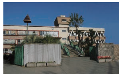
和泉中学校 (徒歩約21分 約1600m)