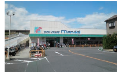
スーパー 万代 (徒歩約17分 約1500m)