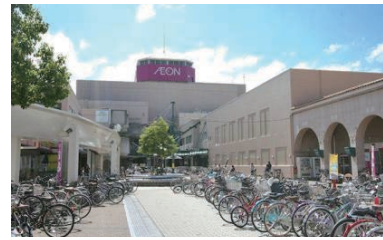
イオン和泉府中 (徒歩約30分 約2500m)