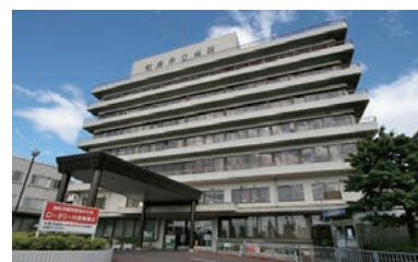
和泉市立病院 (徒歩約25分 約2100m)

「日清ひよこちゃんバック&日清ラーメン詰合せ」を ご見学頂きました方、全員※にプレゼント!